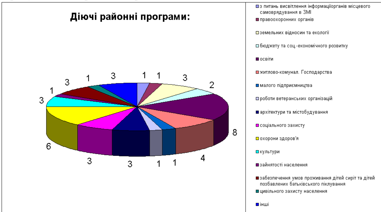
Рис.2. Співвідношення діючих районних програм за спрямуванням

Станом на жовтень 2013 року в районі діє 44 районні програми, 17 з яких були затверджені протягом звітного періоду. Співвідношення за спрямуванням зображено на рис. 2